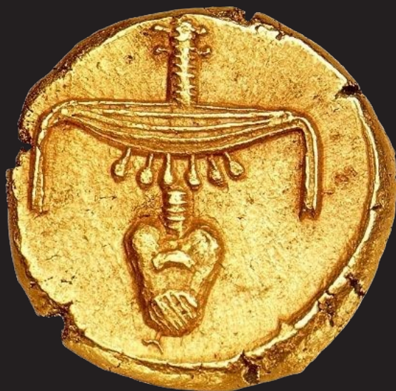
O stater de ouro (egípcio: nfr-nb, "Nefer-nub", significando "ouro fino") foi a primeira moeda cunhada no antigo Egito, por volta de 360 a.C. durante o reinado do faraó Teos da 30ª Dinastia..

O primeiro uso generalizado do ouro por uma civilização ocorreu com os antigos egípcios por volta do ano 3000 a.C. Para os egípcios, o ouro ocupava um lugar especial e encontrou seu caminho em sua mitologia bem documentada, usada em suas estruturas mais sagradas e até assumiu a forma de um tipo duro de dinheiro.